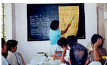
↳ Information sur la gestion à Mindoro.

Les communautés rurales n’ont pas accès aux services basiques de santé. La malnutrition auquel s’ajoutent les pauvres conditions sanitaires, l’isolement ainsi que l’ignorance rend la population de l’intérieur des terres très fragiles à tout type de maladies. Cette situation sanitaire fragile est encore aggravée par les conditions de logements laissées sans analyses de ses effets sur les personnes et l’écologie. »