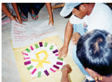
↳ Communauté Ecclésiale de Base dans le Mindoroasic Ecclesial Community at Mindoro

Ceci suit les pas de Saint Vincent . A Châtillon-les-Dombes, il a écrit des textes afin que l’évangile se transforme en acte. Il a constamment demandé à ses disciples de chercher des résultats concrets : les changements réels.